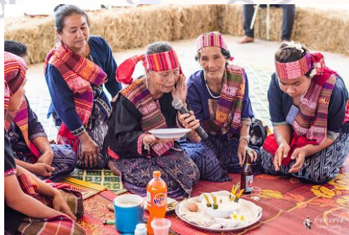
ภาพที่ 2 ตัวอย่างภาพพิธีกรรมที่ใช้ในการสร้างสรรค์