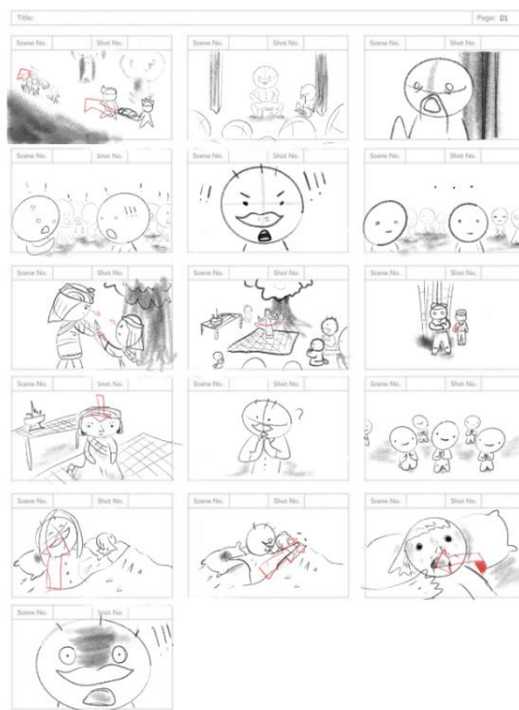
ภาพที่ 1 ตัวอย่างโครงร่างภาพยนตร์สั้น ที่มา : ผลงานทีมงานวาดสตอรี่บอร์ดของผู้วิจัย

ในการสร้างภาพยนตร์สั้นจากความเชื่อในพิธีกรรมเหยาของกลุ่มชาติพันธุ์ไทโส้ อำเภอกุสุมาลย์ จังหวัดสกลนคร สู่ภาพยนตร์สั้นเรื่อง Waiting of Love/แม่แก้ว เป็นการศึกษาข้อมูลจากตำราเอกสารและข้อมูลจากภาคสนาม จากนั้นนำข้อมูลมาวิเคราะห์เพื่อเป็นแนวคิดในการสร้างสรรค์ภาพยนตร์สั้นเพื่อนำเสนอความเชื่อของพิธีกรรมเหยา ซึ่งจะทำให้คนที่สนใจในความเชื่อของพิธีกรรมเหยาและหาคำตอบไปด้วยกัน