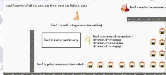
ภาพที่ 2 แผนผังในการจัดงานในปี พ.ศ. 2540 และ ปี พ.ศ. 2541 และ ในปี พ.ศ. 2553

แผนผังในการจัดงานในปี พ.ศ. 2540 ในปี พ.ศ. 2541 และ ในปี พ.ศ. 2553 สามารถแบ่งออกเป็น 5 โซน คือ โซนที่ 1 ศาลาที่ประดิษฐานขององค์หลวงพ่อใหญ่ โซนที่ 2 ลานกิจกรรมพิธีเปิดงาน โซนที่ 3 ปราสาทรวงข้าวทรงระฆังคว่ำ ปราสาทรวงข้าวทรงจตุรมุข ปราสาทรวงทรงพระธาตุพนม ปราสาทรวงข้าวทรงจตุรมุข โซนที่ 4 ลานกิจกรรมมหรสพ และ โซนที่ 5 บูธนิทรรศการและการจำหน่ายสินค้า