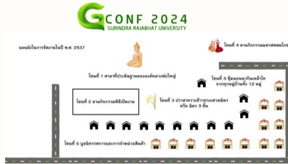
ภาพที่ 1 แผนผังในการจัดงานในปี พ.ศ. 2537

การประชุมนำเสนอผลงานวิจัยบัณฑิตศึกษาระดับชาติและนานาชาติ มหาวิทยาลัยราชภัฏสุรินทร์ ครั้งที่ 14 “ซอฟต์แวร์” นวัตกรรมและปัญญาประดิษฐ์สู่การพัฒนาท้องถิ่นเศรษฐกิจสร้างสรรค์และสิ่งแวดล้อมอย่างยั่งยืน